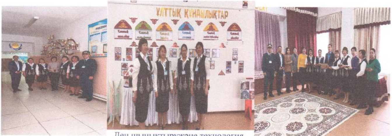
Ден шынықтыру және технология

Апталықтың ашылуы 12.02.2024 ж болды. Салтанатты жиын пән бірлестік мүшелерінің ашық сабақтарын бекіту, Еңбек, кітап көрмесін ұйымдастырылды. Жоспар жасалынып бекітілді.